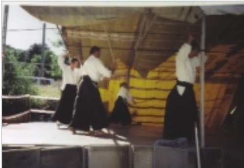
Kata-Übung mit Bokken

Es werden jeweils morgens und abends eine Trainingseinheit angeboten. Zur Halbzeit des Camps ist ein trainingsfreier Tag geplant. Das Lehrkonzept sieht vor, dass, anders als üblicherweise auf unseren Lehrgängen, jeder sein Wissen einbringen kann. Wir wollen gemeinsam Erfahrungen austauschen. Wir wollen auch Themen behandeln, die vielleicht auf den ersten Blick etwas ungewöhnlich scheinen. Selbstverständlich sollen auch ungewöhnliche Fragen mit qualifizierter Unterstützung praktisch auf der Matte beantwortet werden.